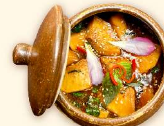
Sa kê om đậu hũ 🌿 (Braised breadfruit with tofu) 155.000 VND