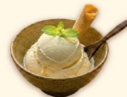
Kem (Vani/Socola) Ice-cream (Vanilla/Chocolate)