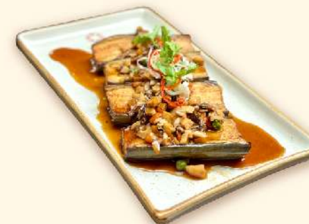
Cà tím nướng sốt nấm xào 🌿 (Grilled Eggplant with sauteed mushroom sauce) 155.000 VND