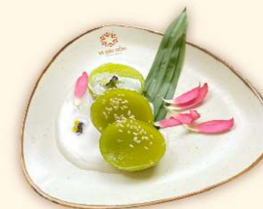
Bánh da heo cốt dừa (Vietnamese layer cake with coconut milk)