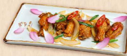
Cánh gà chiên mắm (Vietnamese fish sauce fried chicken wings) 195.000 VND