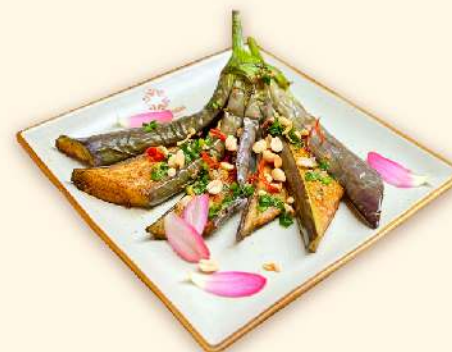
Cà tím nướng mỡ hành 🌿 (Grilled Eggplant with spring onion oil) 155.000 VND