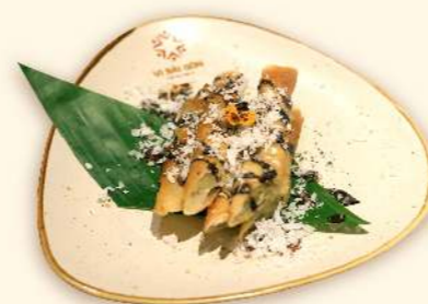
Bánh cuộn chuối (Vietnamese banana crepe rolls)