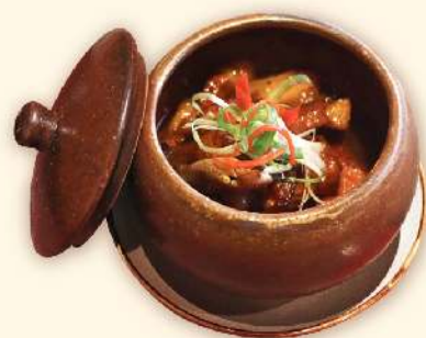
Cá kho tộ (Traditional Vietnamese Braised caramelized fish) 185.000 VND

★ Món ngon đặc biệt Chef recommended 🌿 Món chay Vegetarian