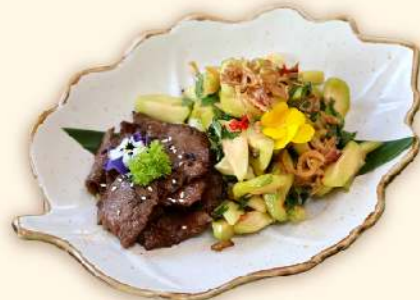
Gỏi cóc non bò nướng (Grilled beef and young ambarella fruit salad)