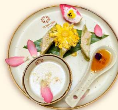
Bánh đúc gân lá dứa cốt dừa (Vietnamese pandan rice cake with coconut milk)