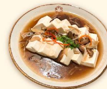
Đậu hũ non sốt nấm nhật 🌿 (Soft tofu with Japanese mushroom sauce) 155.000 VND