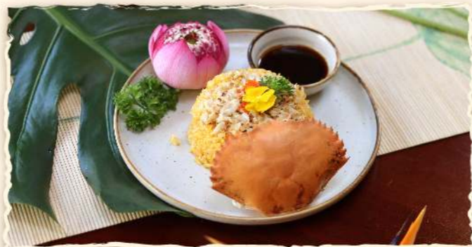
Cơm chiên với Cua/Gà/Bò/Rau củ (Fried rice with Crab/Chicken/Beef/Vegetarian)