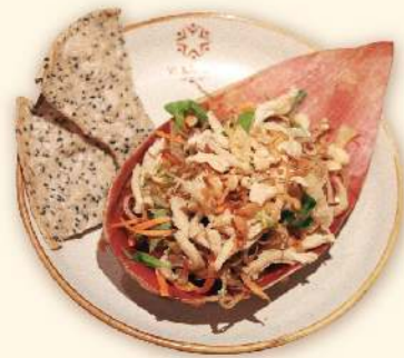
Gỏi gà bắp chuối (Banana flower salad with roasted chicken)