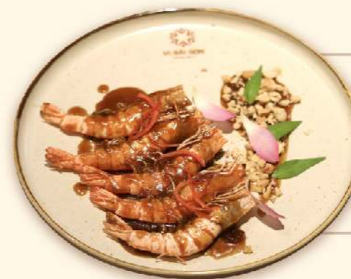
Tôm nướng sốt me ★ (Grilled prawns with tamarind sauce) 265.000 VND