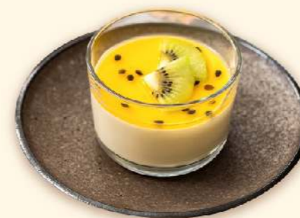
Panna cotta (chọn vị Chanh leo/Dâu tằm) Panna cotta (choice of Passion fruit or Mulberry)