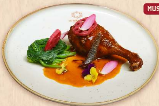
Đùi vịt khìa nước dừa sốt dừa quế ★ (Braised duck thighs with coconut juice & cinnamon sauce) 325.000 VND