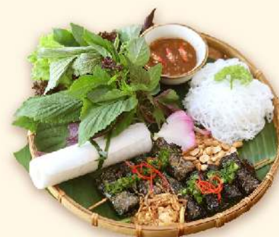
Chả lá lốt rau củ 🌿 (Grilled veggie piper lolot rolls) 155.000 VND