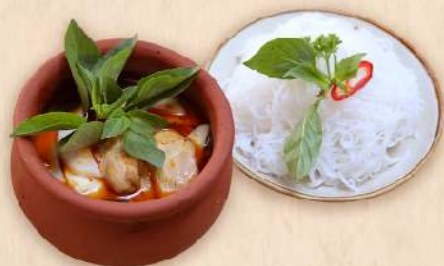
Gà nấu lá húng (Chicken broth with Vietnamese basil) 195.000 VND