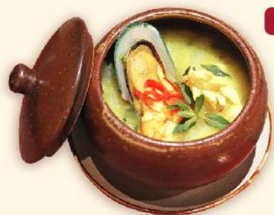
Hải sản om kiểu Vị Sài Gòn ★ ("Vị Sài Gòn" Special Seafood Broth) 295.000 VND