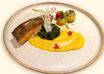
Cá hồi áp chảo với hạt sen nghiền & sốt Chimichurri chấm chéo (Seared Norway Salmon with pumpkin lotus mash & Vietnamese Chimichurri sauce ) 345.000 VND