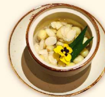
Chè hạt sen Huế ("Hue" lotus seed sweet soup)