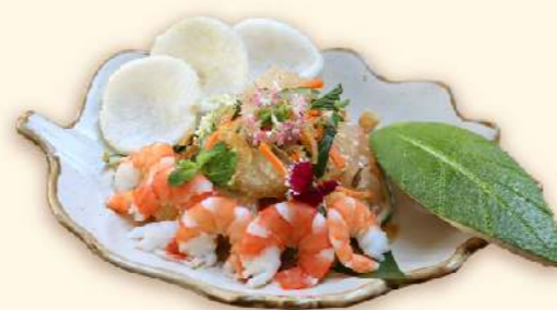
Gỏi bưởi tôm nướng (Pomelo salad with grilled prawns)