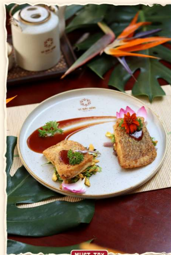
Phi lê cá điêu hồng nướng với sốt me ★ (Grilled Red Tilapia fillet with tamarind sauce) 255.000 VND