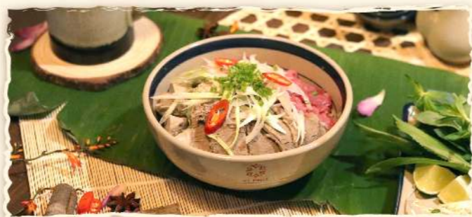
Phở bò chín/Phở gà (Vietnamese "Pho" with Beef or Chicken)