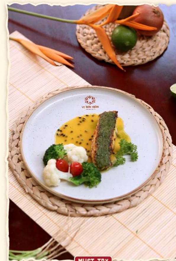
Cá chẽm ướp rau rừng Đà Lạt áp chảo ★ (Seared marinated seabass with Da Lat wild vegetables) 325.000 VND