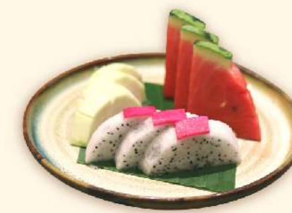
Trái cây theo mùa Seasonal fruit plate