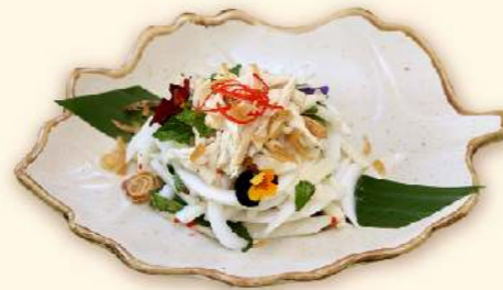
Gỏi gà Bạch Tuyết ("Snow white" chicken salad)