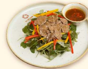
Gỏi rau càng cua bò tái với sốt me (Pepper elder salad with beef & tamarind sauce)