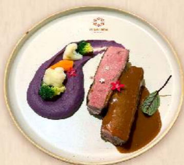
Ức vịt áp chảo sốt dâu tằm (Seared duck breast with wildberry sauce & sweet potatoes mash) 325.000 VND