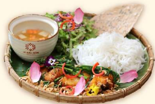
Chả cá Lã Vọng ("Cha ca La Vong" - Special Vietnamese grilled fish cake) 275.000 VND