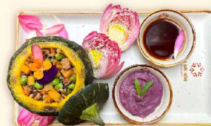
Bí đỏ nhồi nấm nướng 🌿 (Stuffed pumpkin with mushroom) 155.000 VND