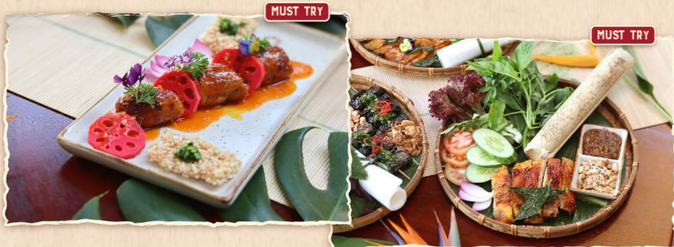
Gà cuộn nướng sốt Vị Sài Gòn ★ (Grilled lemongrass chicken rolls with Vi Sai Gon homemade sauce) 225.000 VND