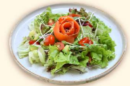
Xa lát rau xanh với bơ và cá hồi muối (Smoked salted salmon avocado salad)